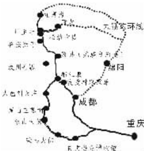
图3 重庆旅游学院旅游野外实习线路示意图

根据既订的教学计划和实习成本核算,旅游野外实习方案与课程紧密结合,以九寨沟为最终目的地(图3),注重各级各类旅游资源的组合(表1),实习时间设计为9d,实习时间选择在旅游淡季(旅游黄金周前或后),这段时间旅游地游客相对较少,住宿等成本相对较低。学生对该实习方案的认同度达到97%(3%的学生认为时间偏长)。